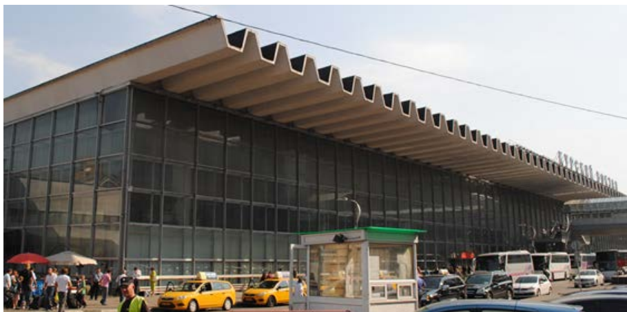
Рисунок 1. Общий вид обследуемого здания

В 1972 году, вследствие возросшего пассажиропотока, было возведено новое здание вокзала при сохранении старых помещений с колоннадой и богатой лепкой внутри. Старый Курский вокзал стал небольшой внутренней частью нового, сохранив архитектурный декор в одном из центральных залов.