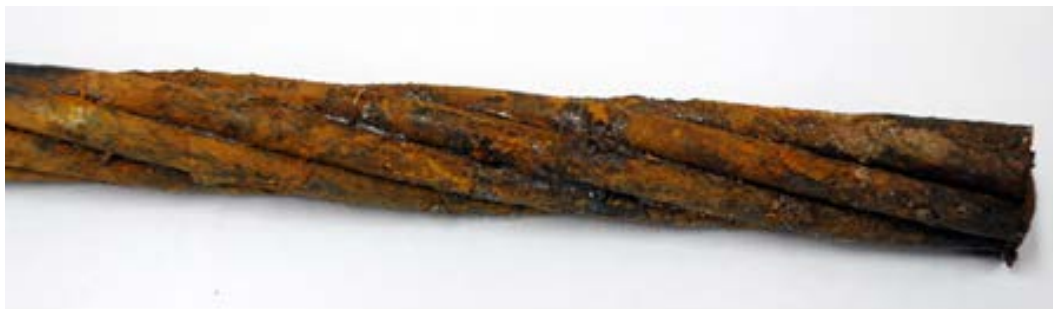
Рисунок 2. Состояние арматурных канатов